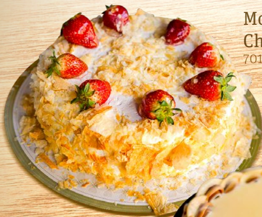
Morango com Chantilly 7018